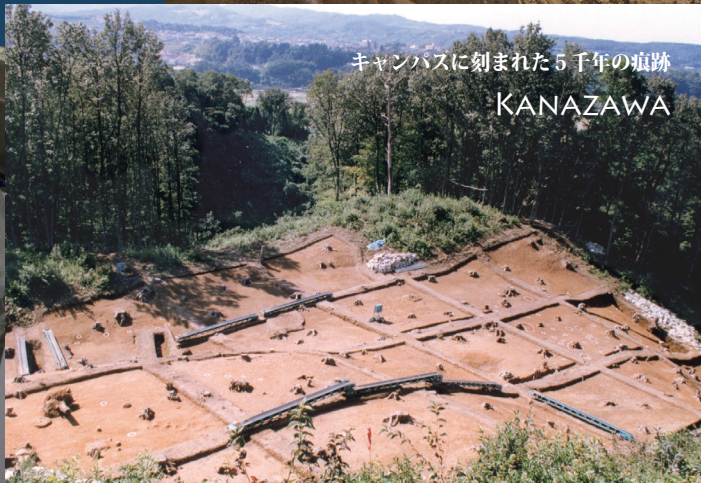
キャンパスに刻まれた5千年の痕跡