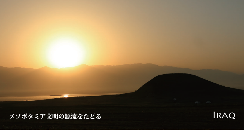
メソポタミア文明の源流をたどる