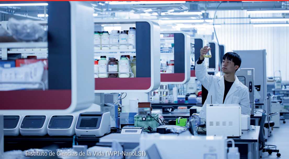
Instituto de Ciencias de la Vida (WPI-NanoLSI)