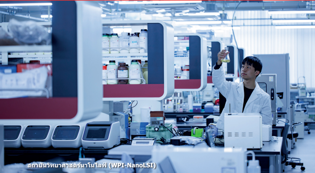
สถาบันวิทยาศาสตร์นาโนไฟ (WPI-NanoLSI)