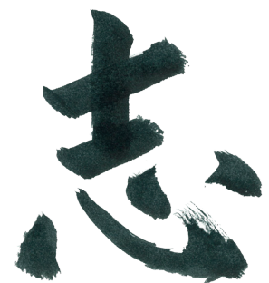
Kokorozashi (ความปรารถนา) อักษรวิจิตรศิลป์ญี่ปุ่นที่เขียนโดยประธาน Wada

นอกเหนือจากกลยุทธ์ “วิทยาเขตทั่วโลก” แล้ว วิสัยทัศน์ “Kokorozashi” ของมหาวิทยาลัยคานาซาวะยังเน้นไปที่การสร้างมูลค่าให้กับอนาคตด้วย “ปัญญาที่มุ่งสู่ออนาคต” ซึ่งมหาวิทยาลัยกำหนดให้เป็นการสำรวจและเอาชนะปัญหาในอนาคต ตลอดจนแก้ไขปัญหายุ่งยากในปัจจุบัน โดยไข่มุมมองสองมุม ได้แก่ มุมมองระดับท้องถิ่นและระดับโลก ตัวอย่างเช่น สถาบันกำลังเพิ่มจำนวนผู้ลงทะเบียนเรียนในหลักสูตรที่ส่งเสริมความเชี่ยวชาญที่สำคัญต่อการรับมือกับความท้าทายของการเปลี่ยนแปลงทางดิจิทัล “ทักษะดิจิทัลมีความจำเป็นสำหรับผู้นำในอนาคตของ