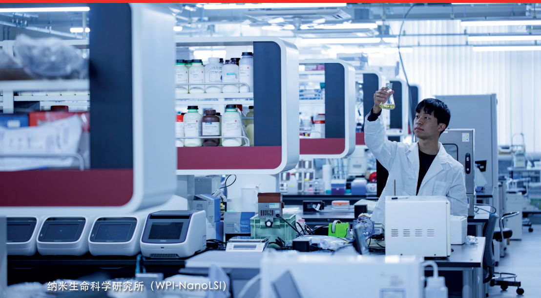
纳米生命科学研究所 (WPI-NanoLSI)