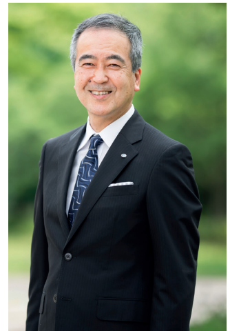
Takashi Wada, Presidente, Kanazawa University

Además de la estrategia de campus global, la visión Kokorozashi de la Universidad de Kanazawa hace hincapié en su compromiso de crear valor para el futuro a través de la "inteligencia orientada al futuro", que define como la exploración y resolución de problemas futuros, así como la solución de los actuales, utilizando dos perspectivas: la local y la global. Por ejemplo, el instituto está aumentando el número de matriculaciones en cursos que desarrollan habilidades cruciales para afrontar los retos de la transformación digital. "Las competencias digitales son esenciales para los futuros líderes de nuestra sociedad", afirma el Sr. Wada.