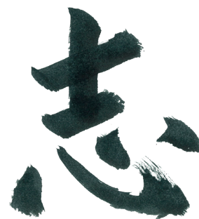
Kokorozashi (抱负) —— Wada校长所写的日本书法

除了“全球校园”战略，金泽大学“Kokorozashi”愿景的另一个重点是通过“面向未来的智能技术”创造未来价值，金泽大学将其定义为以本地和全球两个视角来探索和克服未来问题，以及解决当前问题。例如，大学正在为培养相关专业知识的课程增加招生人数，以应对数字化转型的挑战。“数字技能对我们